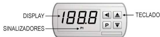
Fig. 02 – Painel frontal do controlador

No painel frontal do controlador o sinalizador P1 acende quando a saída de controle é ligada.